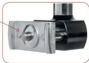
Probe r8 Puntale r8