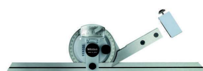
187-908 s držákem pro výškoměry