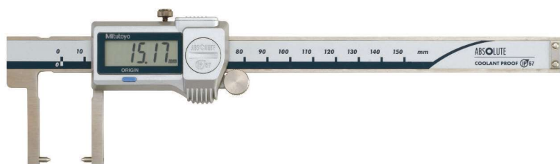
573-652-20 Provedení se špičatými hroty