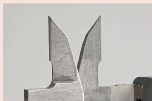
Měřicí čelisti pro vnější/vnitřní měření osazené tvrdokovem Obj. č. 505-735