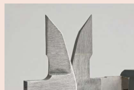
Měřicí čelisti osazené tvrdokovem