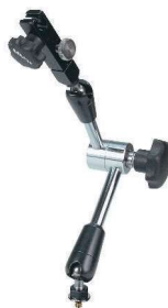
011362 Rozměry: viz 011359