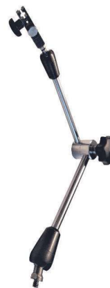
011363 Rozměry: viz 011360