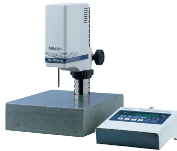
LITEMATIC VL-50 s volitelným měřicí stojanem (obj. č. 957460)

Pro více informací si vyžádejte prospekt LITEMATIC.