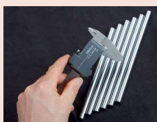
Posuvné měřítka s bezdrátovým systémem přenosu dat U-WAVE fit