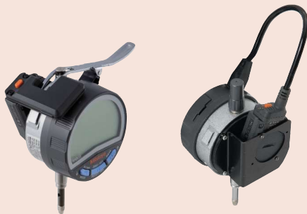
02AZF670 U-WAVE-TM 02AZD790F úchylkoměr ID-C