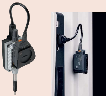
02AZF675 U-WAVE-TM 02AZD790G 02AZE990 Držák pro U-WAVE-T pro QM-Height