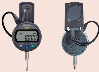
02AZE200 Držák pro U-WAVE-T pro úchylkoměry, posuvná měřítka z uhlíkových vláken