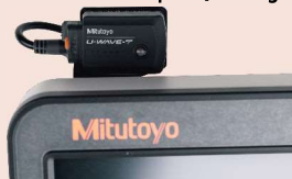
12AAY486 U-WAVE-T 02AZG011