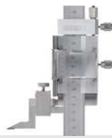
Höhenmess- und Anreißgeräte analog Analog height gauges