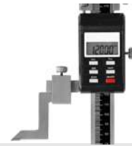
Höhenmess- und Anreißgeräte digital Digital height gauges