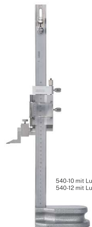
540-10 mit Lupe* 540-12 mit Lupe*