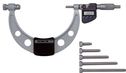
340-251-30 (IP65 pro modely s roz. měř. nad 300mm)