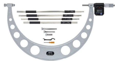
340-520 (modely s roz. měř. nad 300mm bez ochrany IP65)