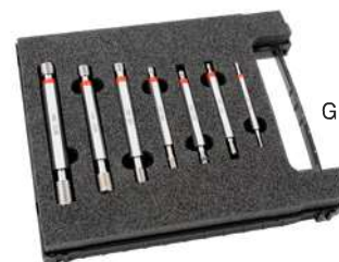
Grenzgewinde-Lehrdorn-Satz Thread plug gauges in set Seite/page 151