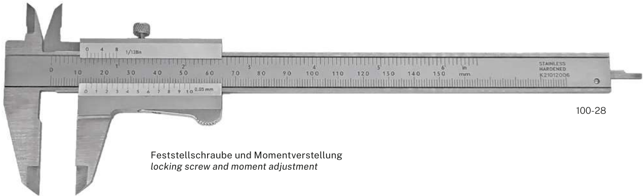
Feststellschraube und Momentverstellung locking screw and moment adjustment