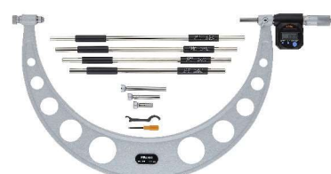
340-520 (modely s roz. měř. nad 300mm bez ochrany IP65)