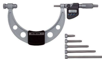
340-251-30 (IP65 pro modely s roz. měř. do 300mm)