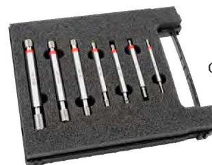
Grenzwende-Lehdorn-Satz Thread plug gauges in set Seite/page 143