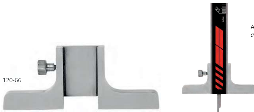
Anwendungsbeispiel application example