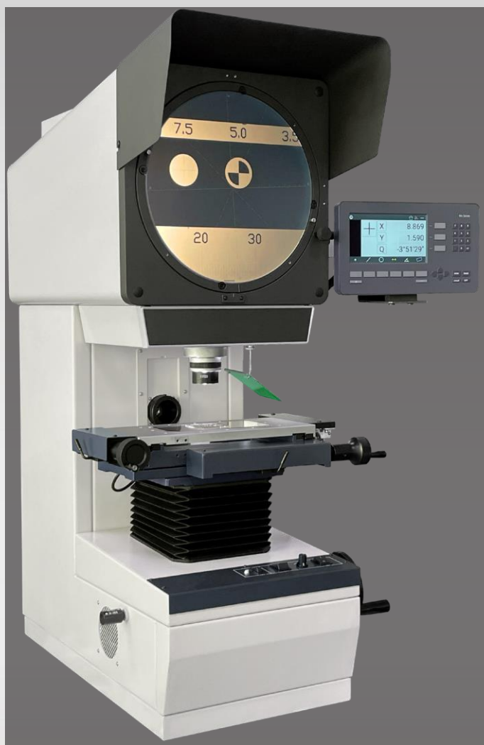
Profilový projektor HTP3020