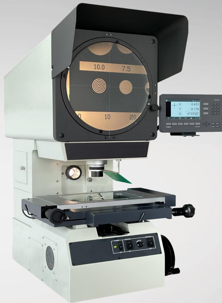
HTP3020 s displejem Mx200